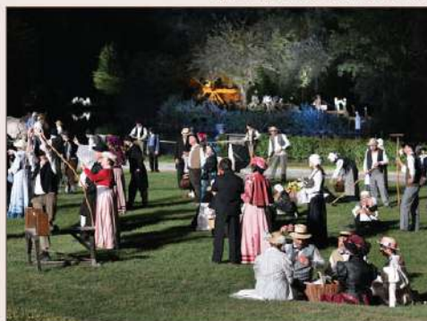
© LE SOUFFLE DE LA TERRE