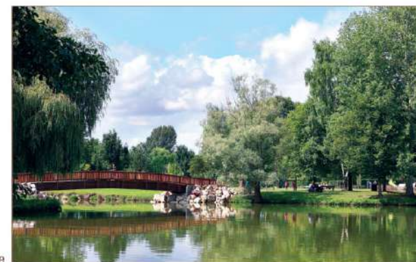
Plan d'eau de Berny-sur-Noye

• Comité Somme : http://rando80.fr • Rando Val de Noye : http://randonoye.e-monsite.com/